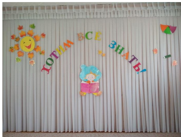
для младшего и среднего звена