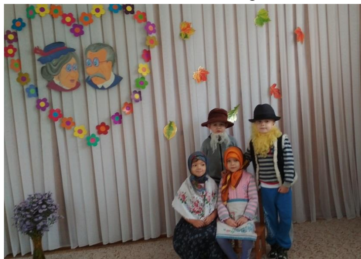
День пожилого человека

Только совместными усилиями педагогов, руководителя нашего структурного подразделения, а также части родителей, обладающего всеми этими качествами, и удалось создать удивительно доброю, красочную атмосферу этого золотого времени года.