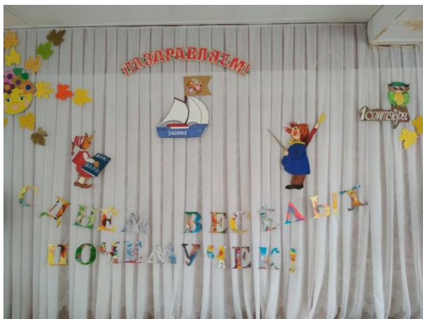
для старшего возраста