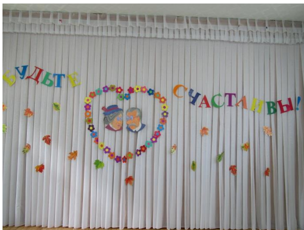
День Пожилого человека