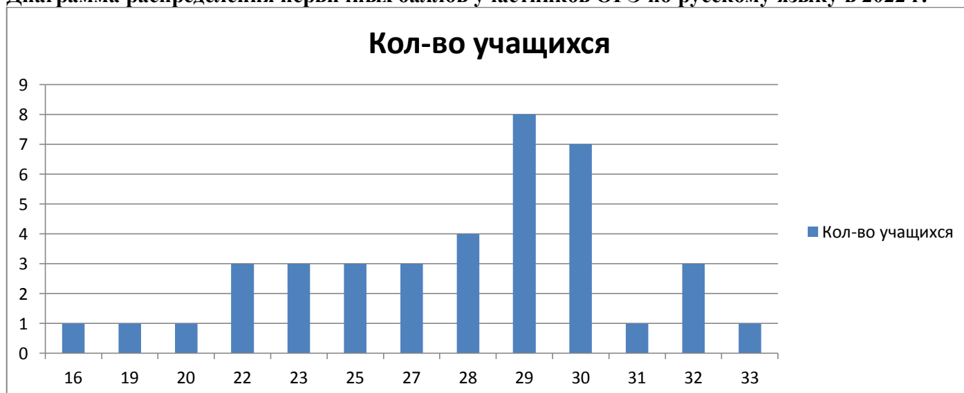
Диаграмма распределения первичных баллов участников ОГЭ по русскому языку в 2022 г.

На основании таблицы №2 и №3 можно выстроить диаграмму распределения образовательных результатов обучающихся 9-х классов по русскому языку в ГБОУ СОШ «Центр образования» г. Чапаевска.